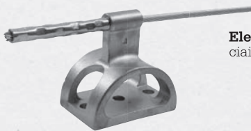
Elemento d'estremità in acciaio inox