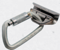
Navetta di scorrimento con chiusura automatica

Securope® è una linea vita su fune flessibile conforme alla norma EN 795 Classe C studiata per coperture metalliche (in acciaio 6/10 o alluminio 10/10), ma, grazie ai suoi elementi di dimensioni ridotte e alla notevole adattabilità anche a percorsi movimentati, riscuote notevole successo anche nelle applicazioni su edifici di valore storico. Il sistema può essere installato sui principali modelli di coperture metalliche grazie ad appositi fissaggi - studiati con i produttori di lamiera - che consentono di fissare le piastre senza praticare fori. La linea vita è flessibile anche direttamente sulla struttura in C.C.A. o acciaio adeguatamente dimensionata. La linea Securope® è composta da elementi d'estremità fissi e da intermedi che, in caso di caduta dell'operatore, si abbattono assorbendo parte dei carichi che altrimenti verrebbero trasmessi alla struttura. Trattandosi di un sistema deformabile deve essere sottoposto ad un programma di revisione periodica (annuale) e straordinaria dopo l'entrata in servizio in caso di caduta. La deformazione è meccanica, non plastica, e consente il ripristino della linea, previa verifica della struttura. Esiste anche la possibilità di giunzione del cavo o sostituzione parziale dello stesso. Il sistema è composto da elementi in acciaio inox coperti da garanzia decennale, è omologato fino a 4 operatori, due per campata, ed è utilizzabile solo con apposita navetta di scorrimento. La linea vita Securope® è certificata da Apave.