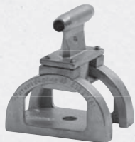
Elemento intermedio in acciaio inox. In caso di caduta la parte superiore si abbatte per ridurre gli sforzi trasmessi al cavo e alla struttura.